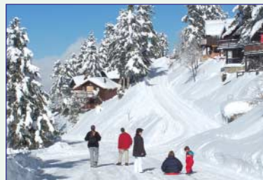
Station de Guzet à 20 mn

Sports d'hiver : Ski de piste, de fond, Surf - Raquettes.