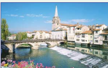
St-Girons et le Salat

Activités : Randonnées pédestres, VTT - Cyclotourisme, Pêche, Sports d'eaux vives, Equitation - Parapente.