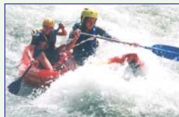
Sports d'eaux vives