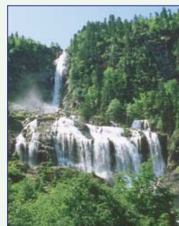
Cascade d'Ars (110 m)