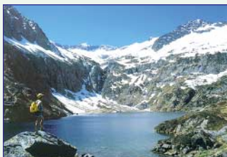
Etang du Garbet