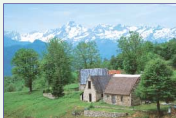
Granges de Cominac (200 km de pistes VTT)