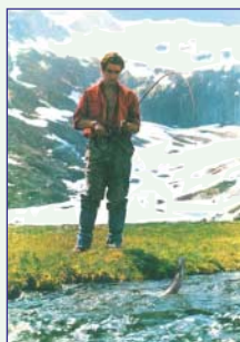
Pêche en lacs et rivières