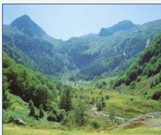
Cirque de Cagatelle